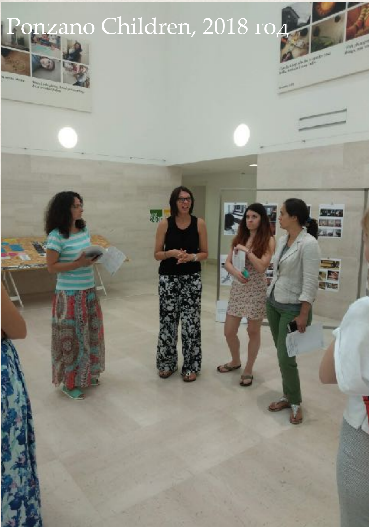
Ponzano Children, 2018 год