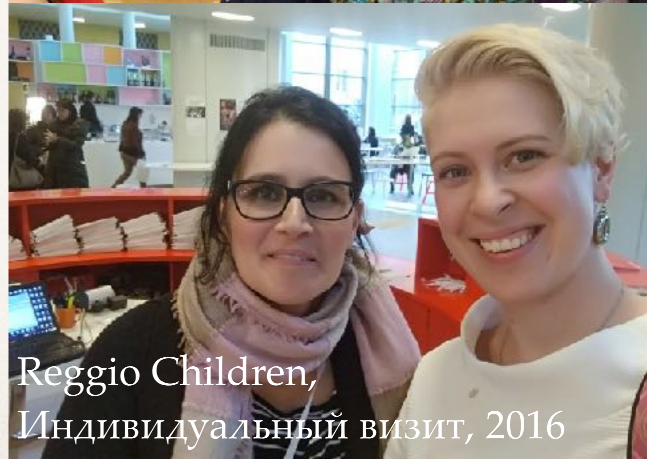
Reggio Children, Индивидуальный визит, 2016