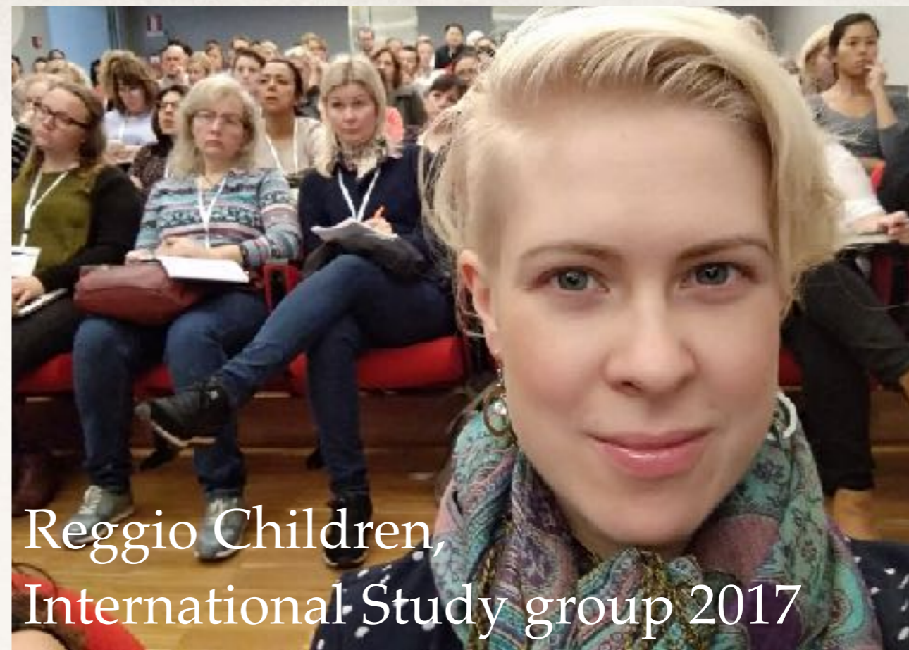
Reggio Children, International Study group 2017