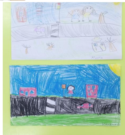
Рисование «На улице города»

Консультация для родителей «ПДД для малышей»