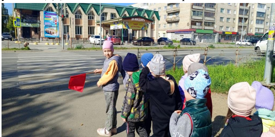
экскурсия к перекрестку

Правила дорожного движения для детей, рассказанные в простой и понятной форме, — шаг на пути к осознанному поведению на городских улицах.