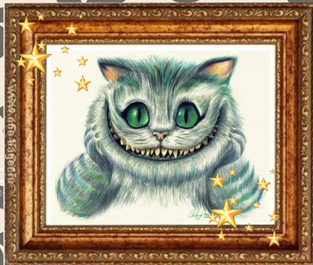
Чеширский кот «Алиса в стране чудес»