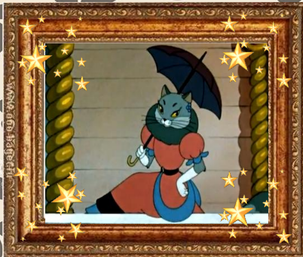
Кошқа «Кошқин дом»