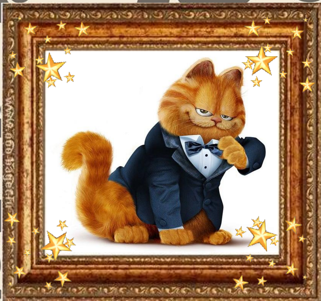
Кот Гарфилд «Гарфилд»