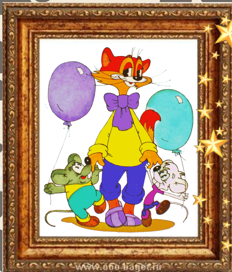
Кот Леопольд «Приключения кота Леопольда»