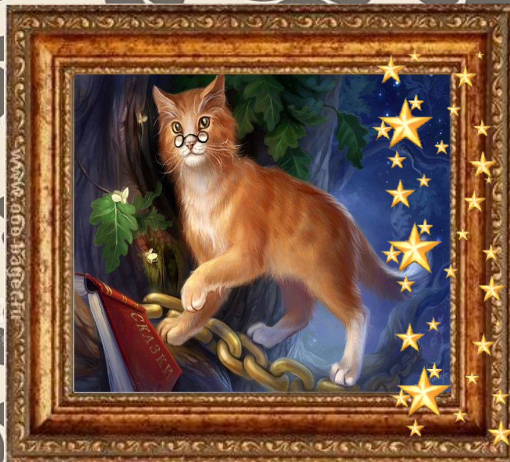
Кот Баюн «Лукоморье»