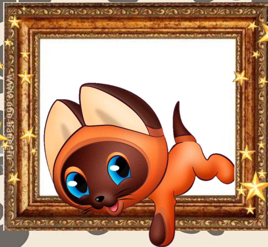
Котёноқ Тав «Котёноқ по имени Тав»