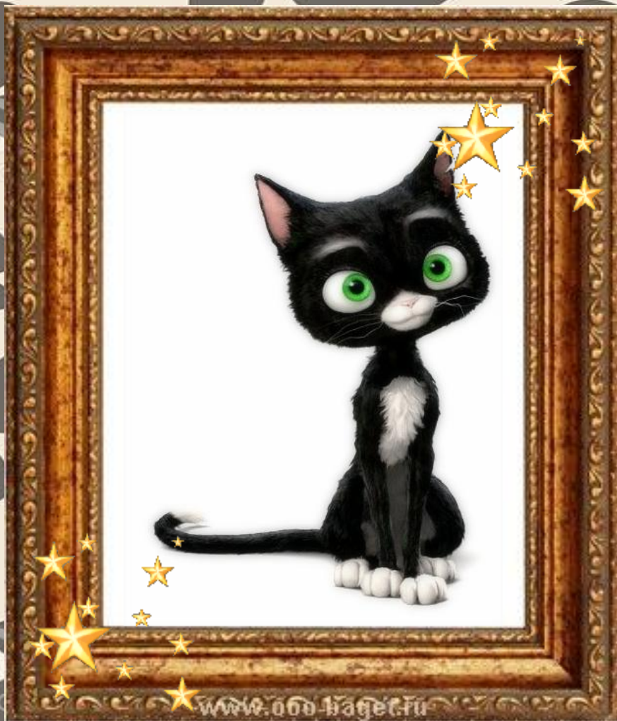
Кошка Варезка «Вольт»