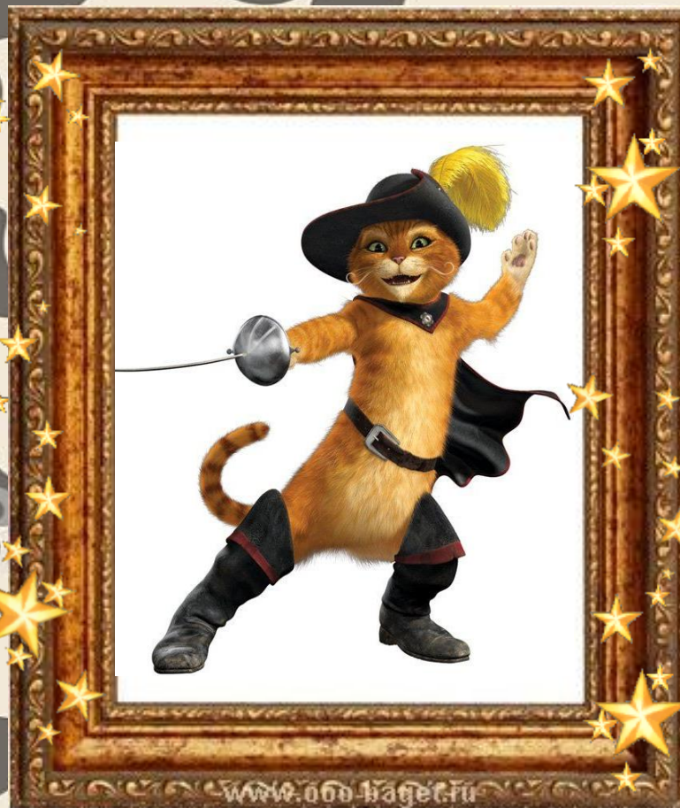
Кот в сапогах «Кот в сапогах»