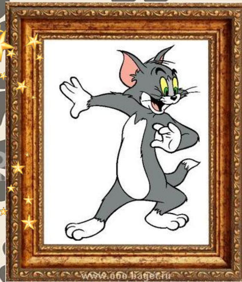
Кот Том «Том и Джерри»