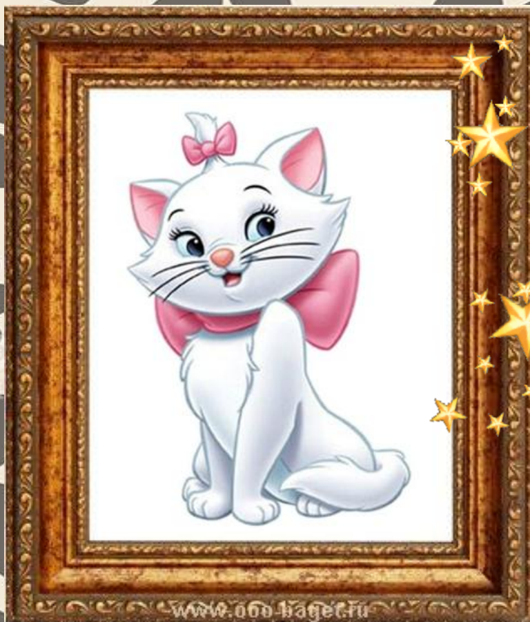
Кошқа Мари «Коты – аристократы»