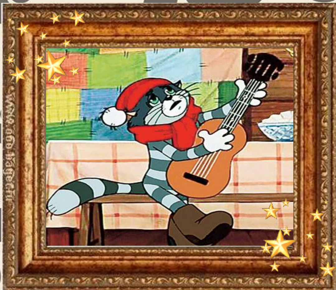
Кот Матроскин «Простоквашино»