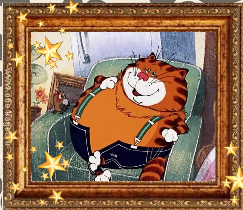
Кот Базилио «Приключения Буратино»