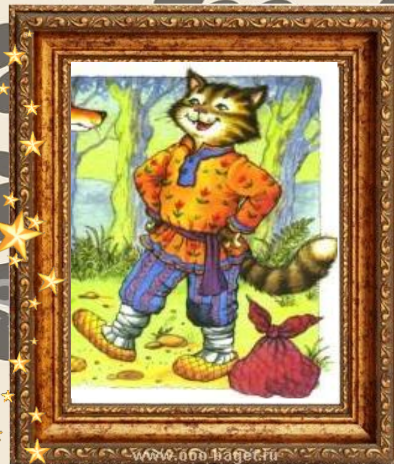
Котофей Иванович «Кот и Лиса»